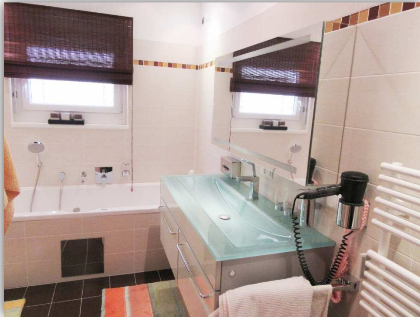
11: BAD MIT WC, WANNE U. DUSCHE