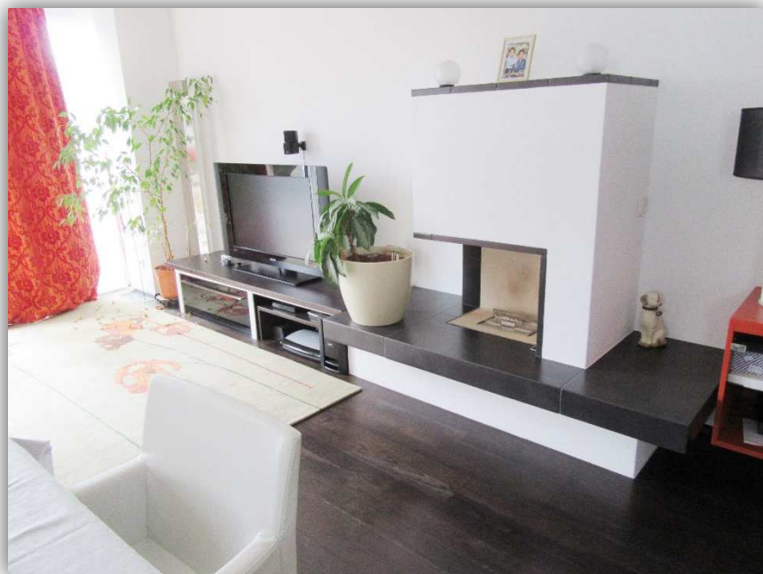
6: WOHNEN MIT KAMIN

STYRIAN HOMES ® SEIFERT IMMOBILIEN GMBH INNERHOFERSTRASSE 39 8045 GRAZ FN: 507676H UID: ATU74173208