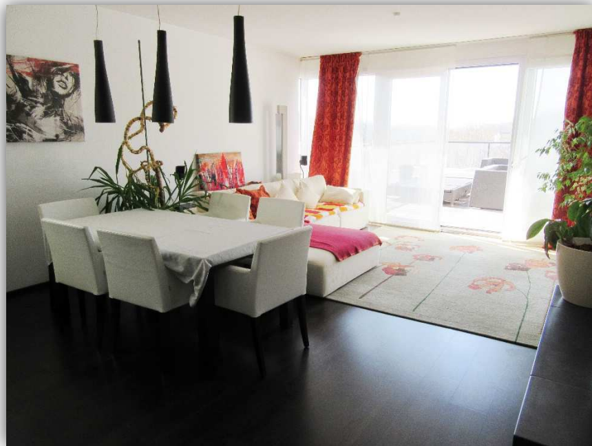
5: KÜCHE - WOHNBEREICH MIT ZUGANG TERRASSE