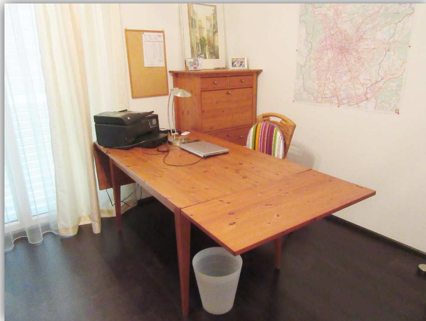
7: BÜRO / KINDERZIMMER