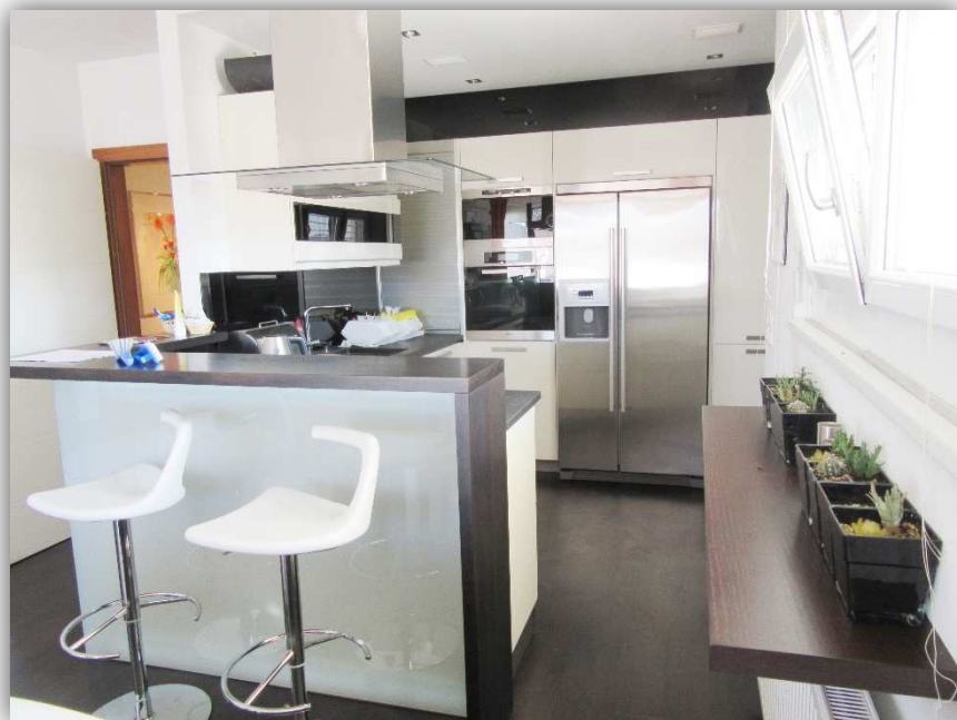
4: KÜCHE MIT BAR

STYRIAN HOMES ® SEIFERT IMMOBILIEN GMBH INNERHOFERSTRASSE 39 8045 GRAZ FN: 507676H UID: ATU74173208