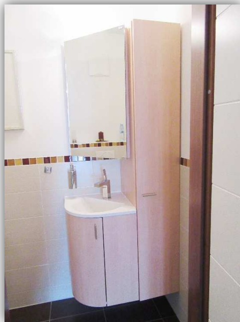
12: GÄSTE WC

STYRIAN HOMES® SEIFERT IMMOBILIEN GMBH INNERHOFERSTRASSE 39 8045 GRAZ FN: 507676H UID: ATU74173208