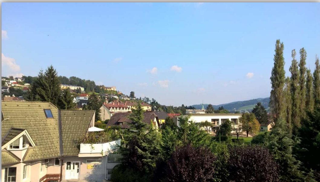
8: AUSBLICK BALKON

STYRIAN HOMES ® SEIFERT IMMOBILIEN GMBH INNERHOFERSTRASSE 39 8045 GRAZ FN: 507676H UID: ATU74173208